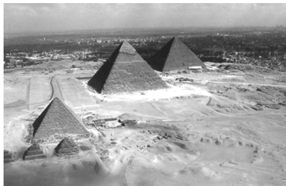
The Giza Pyramids: do they mirror the stars?

(Al-Ahram Weekly On-line, October 16, 2002, Issue No. 607)